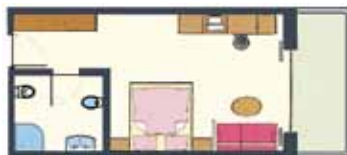
modello camera variabile

24 - 27 m 2 , balcone verso sud, angolo divano, TV, telefono, cassaforte, frigobox, doccia, bidet, WC, asciugacapelli