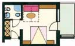
modello camera variabile

nella bassa stagione anche prenotabile come camera singola, supplemento: € 10,00