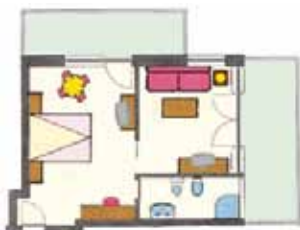
modello camera variabile

41 - 45 m 2 , balcone sud e balcone est/ovest, 2 -4 persone, soggiorno, camera da letto, TV, telefono, cassaforte, frigobox, doccia, bidet, WC, asciugacapelli.