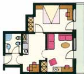
modello camera variabile

45 m 2 , balcone sud, 2 -4 persone, soggiorno, camera da letto, TV, telefono, cassaforte, frigobox, doccia, bidet, WC, asciugacapelli.